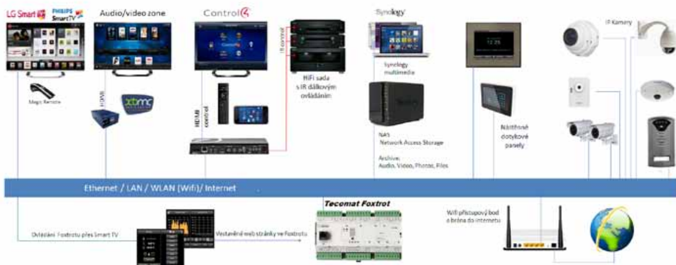
Obr.2 Dvou vodičovou sběrnici CIB se propojí jak moduly v rozvaděči, tak moduly volně rozmístěné po budově

proti vytržení. V domovní systémové instalaci, od které očekáváme maximální spolehlivost, by se měla věnovat péče i takové drobnosti, jako je zajištění konektoru napájení switchu (který aretací většinou nemá) proti náhodnému vysunutí. Dáme přednost tedy takovým zařízením, kde je napájení přivedeno na šroubovací konektor.